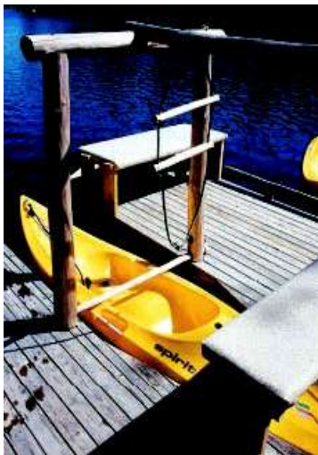
Einstiegshilfe für Kanus